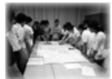
さががけて行った机上訓練