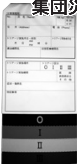
災害時専用のトリアージタグ

豊岡病院は「災害拠点病院」です。今後とも住民の万が一に備えて、災害・事故に対する訓練活動を実施していきます。