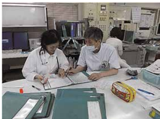
(地域医療研修の様子)