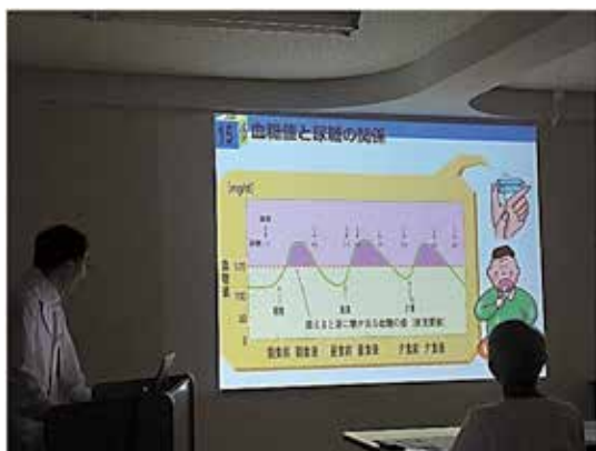
(糖尿病教室の様子)