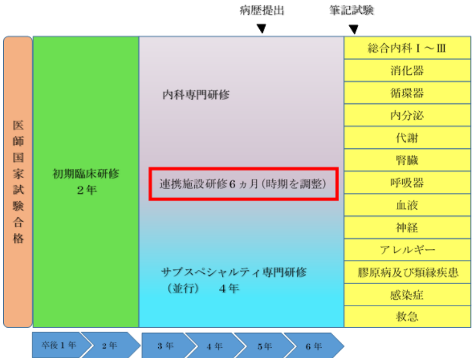
図1 - 2. 公立豊岡病院内科専門研修プログラム (概念図)