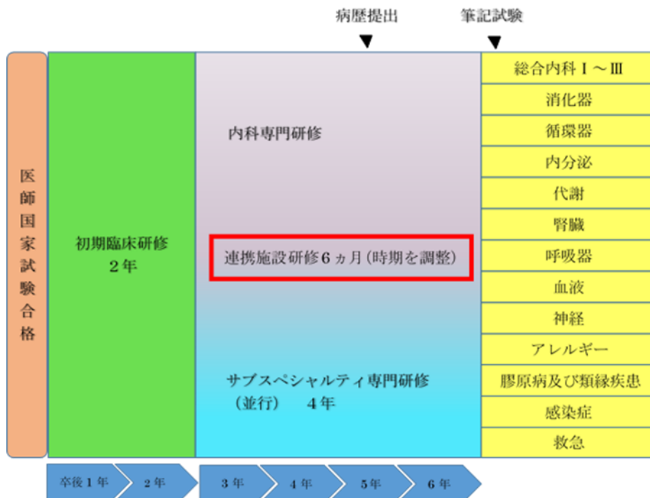
図1 - 2. 公立豊岡病院内科専門研修プログラム（概念図）

（図1 - 1） 基幹施設 2年 6ヶ月間＋連携・特別連携施設 6ヶ月間を基本モデルとした5つのタイプ別研修（専攻医 3年）では、基幹施設である公立豊岡病院内科で、専門研修（専攻医）を 2年 6ヶ月間行います。