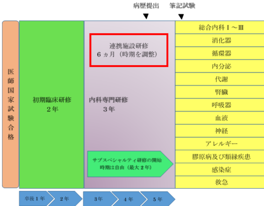
図1-1. 公立豊岡病院内科専門研修プログラム (概念図)