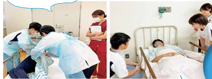
患者さんの安楽を考えて患者さんの気持ちも体験