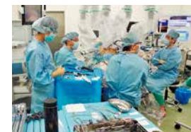
ロボット支援「ダヴィンチ」による手術が導入されます