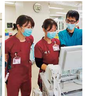
集中ケア認定看護師による指導