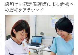
緩和ケア認定看護師による病棟への緩和ケアラウンド