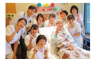
緩和病棟 この時間を大切に

「がん化学療法看護認定看護師」「緩和ケア認定看護師」「乳がん看護認定看護師」は患者さんの直接ケアはもちろんのこと、部署を超えて横断的に活動しています。