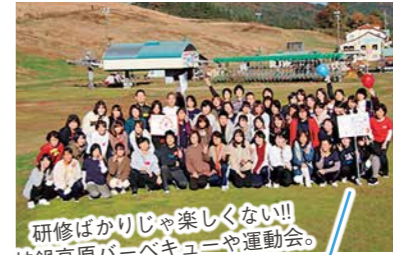
研修ばかりじゃ楽しくない!! 神鍋高原バーベキューや運動会。