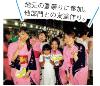
地元の夏祭りに参加。 他部門との友達作り。