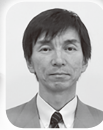
出石医療センター

この装置により、脊椎部と大腿骨部の骨密度を測定できます。測定は約10分で終了し、撮影時に痛み等は伴いません。