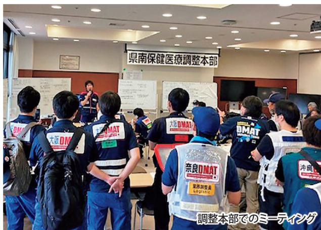
調整本部でのミーティング

豊岡病院は、熊本県を襲った豪雨災害に関し熊本県からの派遣要請を受け、令和2年7月6日夜～10日にかけて災害派遣医療チーム「DMAT」として、医師2名、看護師2名、業務調整員1名を派遣しました。サービスエリアでのDMAT隊19チームの参集集約、八代市内の避難所スクリーニング、芦北町の施設避難者のメディカルチェック等を行いました。