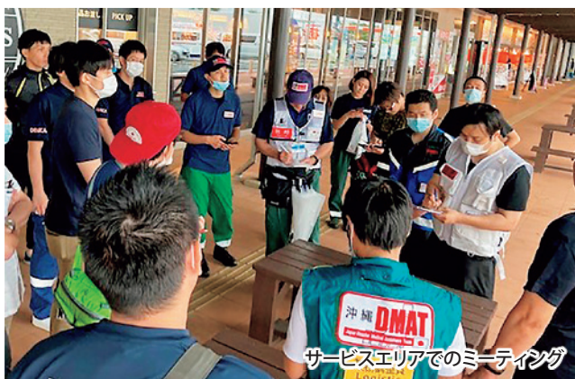
サービスエリアでのミーティング

豊岡病院は、熊本県を襲った豪雨災害に関し熊本県からの派遣要請を受け、令和2年7月6日夜～10日にかけて災害派遣医療チーム「DMAT」として、医師2名、看護師2名、業務調整員1名を派遣しました。サービスエリアでのDMAT隊19チームの参集集約、八代市内の避難所スクリーニング、芦北町の施設避難者のメディカルチェック等を行いました。