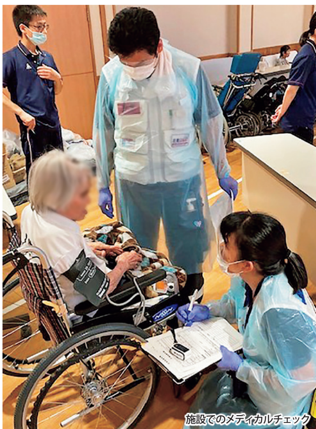
施設でのメディカルチェック