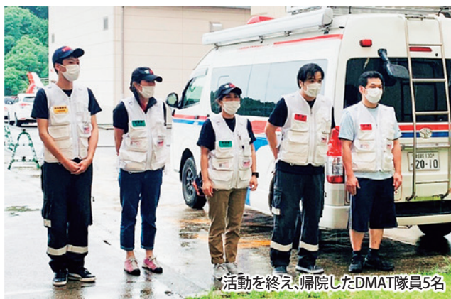
活動を終え、帰院したDMAT隊員5名