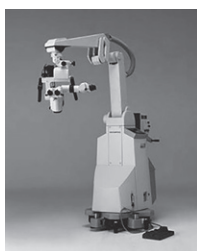
脳外科写真手術顕微鏡