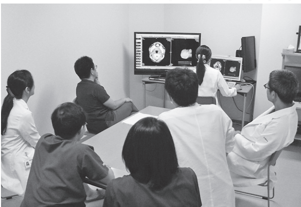
カンファレンス風景

女性の健康を守る産婦人科医として、産科診療だけでなくがん治療なども幅広く対応しています。「但馬の女性の健康は但馬で守る」ということを産婦人科のモットーに、関連する大学などの協力を得ながら、但馬の方々のお役に立てるようスタッフ一丸となって頑張っています。