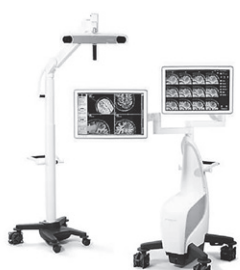
脳外科写真手術ナビゲーションシステム

〈まとめ〉 このように当科では特殊な手技が必要な外科手術や脳腫瘍を除いて、一般的な地方病院としては十分な治療設備を備えており、全国標準的な脳腫瘍治療を提供可能となっております。また、脳腫瘍の治療をされている患者様の精神的肉体的負担は極めて大きなものがあり、我々治療を担当する医師、看護師、薬剤師などは全力を挙げて治療に当たっております。不安なことや心配なこと、分からないことがありましたら、ご遠慮なく主治医や担当の医師、看護師などにお尋ね下さい。