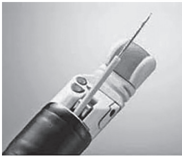
図1 超音波内視鏡の先端の構造

豊岡病院でも2018年4月から機器を本格導入し、超音波内視鏡を活用した画期的な検査・治療で安定した治療成績を収めています。