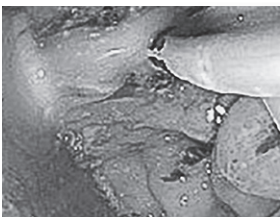
図4 胃内に膿が排出 [内視鏡画像]