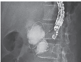
図3 腹腔内膿瘍の造影画像