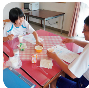
トライやる・ウィークの様子 (P7へ)