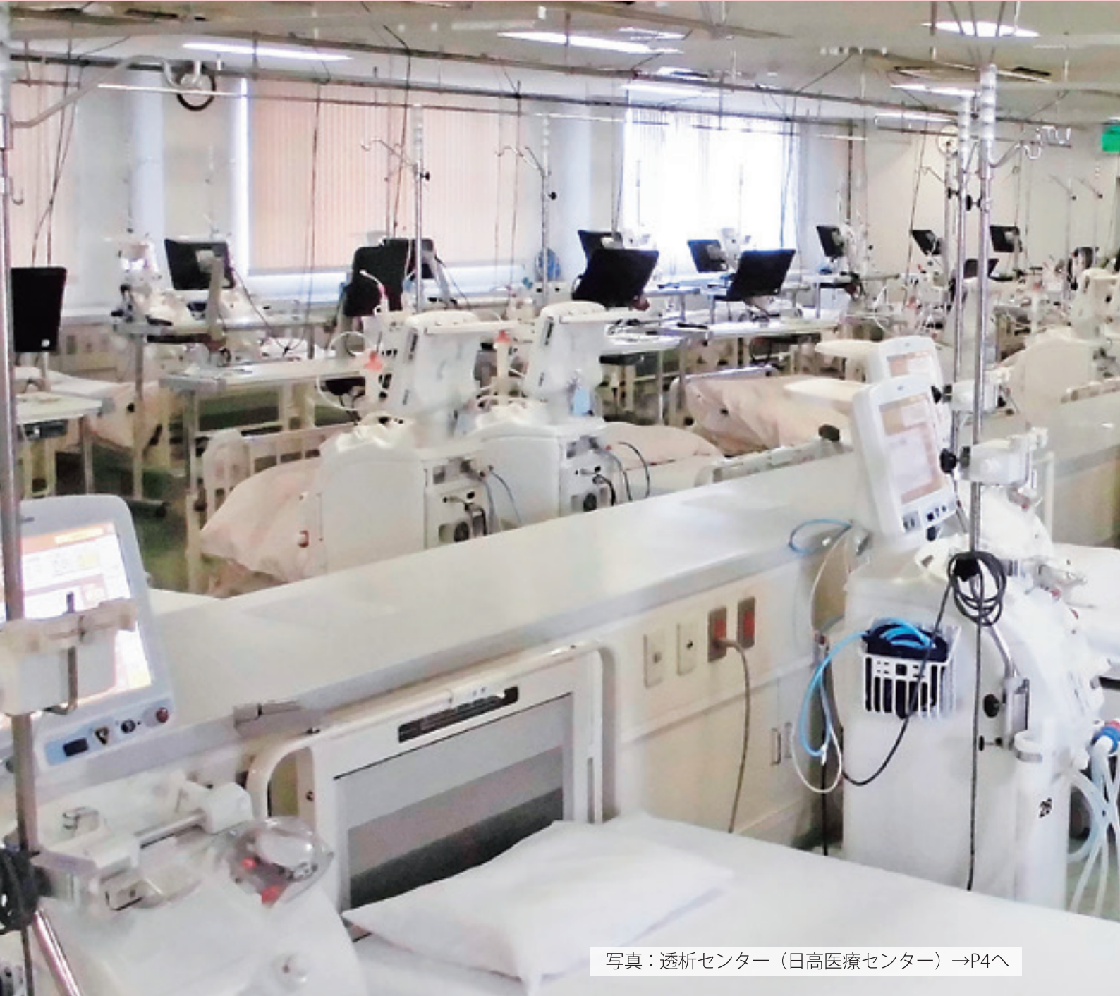
写真：透析センター（日高医療センター）→P4へ