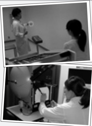
日高医療センター 眼科センター 視能訓練士

視能訓練士は、皆さんの目の健康を守るお手伝いをしています。見え方について、不安なこと、疑問に思うことなど何なりとご相談ください。たとえ見えにくくなってしまっても、生活の質を高めるためにどうすればよいか一緒に考えていきたいと思っています。