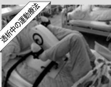
透析中の運動療法

透析治療を受けられる方は、身体活動量が不足しがちで、体力や筋力が低下しやすい傾向にあります。そのため、転倒しやすくなったり、思い通りの日常生活を送ることが困難になったりする可能性があります。そこで、透析中の時間を利用して、自転車こぎ運動を行い、身体機能の改善を図っています。