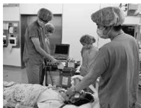
電気けいれん療法の様子

一方で、常勤精神科医数の減少に伴い、今年度4月より一般の初診患者さんの受け入れをお断りせざるを得ない状況となっております。患者ご家族の皆様には大変ご迷惑をおかけしております。受け入れ再開を目指して努力をして参ります。