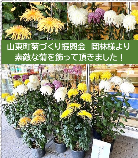
山東町菊づくり振興会 岡林様より 素敵な菊を飾って頂きました！