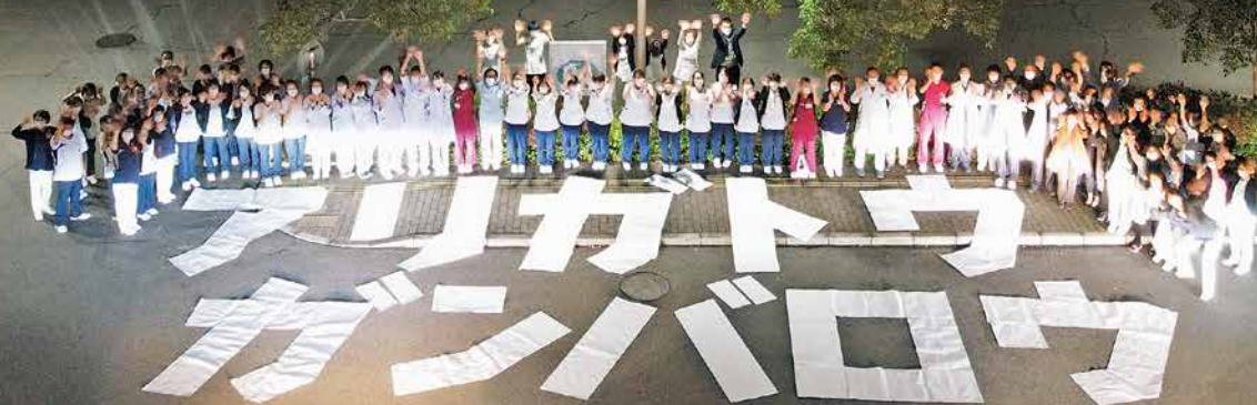
「豊岡病院の前で、職員たちと」

私たちは、地域のみなさまの健康と生命を守り続けるため これからも日々全力で取り組んでまいります