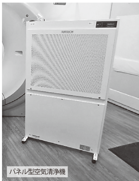
パネル型空気清浄機

また、以前より放射線科では、医師・看護師・診療放射線技師等で感染症対策のシミュレーションを重ね、様々な検査や処置を迅速かつ安全に行えるように取り組んでいます。感染症疑いに限らず、すべての検査において、終了直後に塩素系除菌洗浄剤やアルコールを使用し、装置や室内の清拭を行っています。また、始業前と終業時には科内の椅子や手すりを清拭し、日々の環境整備に努めています。