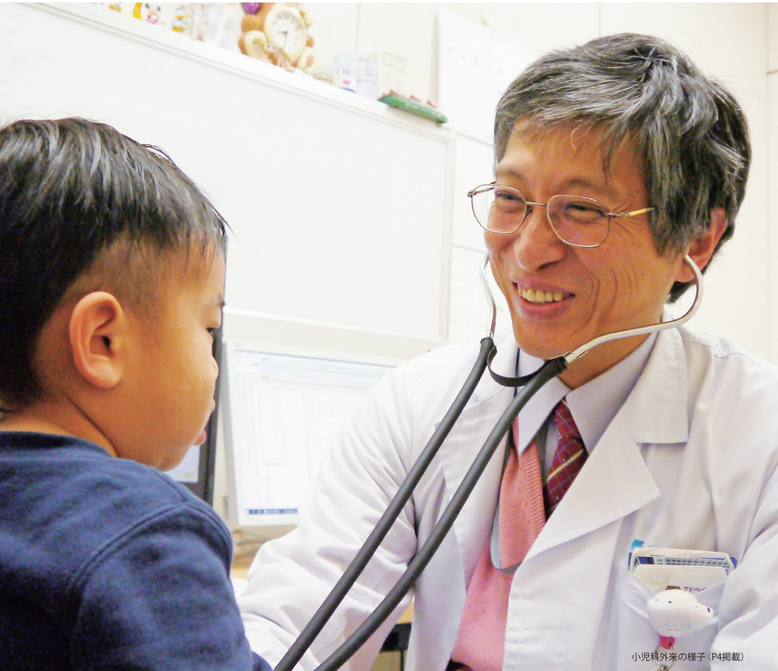
小児科外来の様子 (P4掲載)